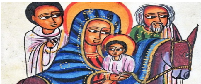
La fuga in Egitto